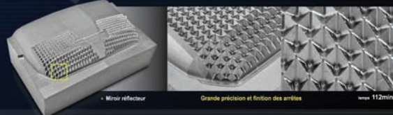
Miroir réflecteur Grande précision et finition des arêtes vitesse 112min.