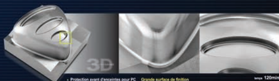
Protection avant d'encantes pour PC Grande surface de finition vitesse 120min.