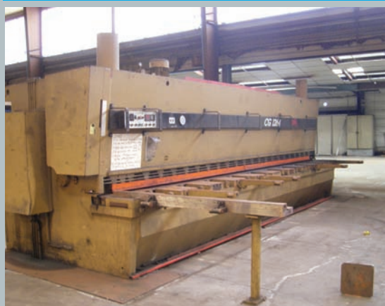
• Cisaille guillotine COLLY 6000 x 12