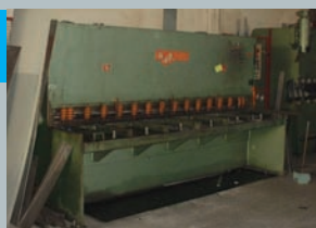
• Cisaille guillotine PRECIMECA 3000 X 6