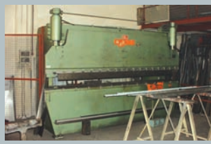
• Presse plieuse DESCOMBES 120 T. x 3250