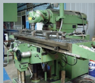
• Fraiseuse à Bélier - Courses : X 1500 Y 500 Z 700