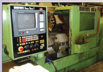
Tour MONFORTS RNC 4 FANUC 15T - 400 x 700 Embarreur IRCO