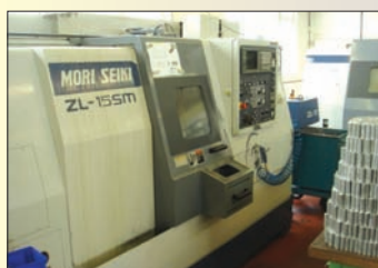
Tour CNC MORI SEIKI ZL 15 FANUC 16T, bibroche bitourelle axe C