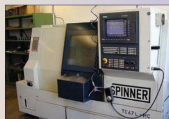
Tour SPINNER Type TC 67L Année 1997 - 3 axes Siemens 840D