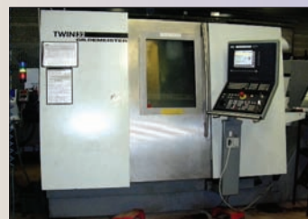
Tour CNC GILDEMEISTER Type 32 BJ - 6 axes Année 2001 Magasin à barre