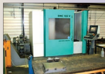
CDMG DMC 103V CNC SIEMENS 810D 1000 x 600 x 600 arrosage centre broche, 30 portes outils ISO, 40 inclus