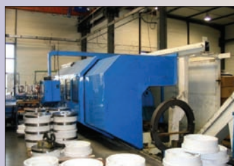
Tour CNC MORANDO Type 1600 x 4000 Année 165/2002 CNC NUM 1060