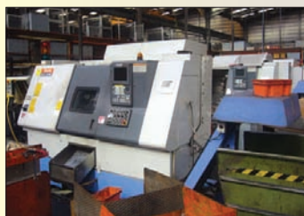
MAZAK SQT 250 MS de 1998 Contre broche, outil motorisé Magasin à barre MAZATROL FUSION 640 T