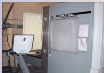
DMG DMC64V LINEAR DE2003 TNC HEIDENHAIN 530 640 x 510 x 510