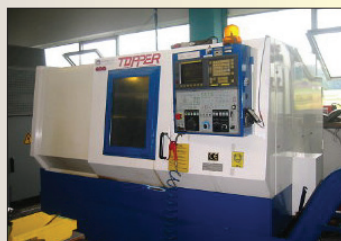
Tour CNC TOPPER TNL 100 de 1996 FANUC OTC - BE Ø 250 x 450 mm - Prix : 23 000 €