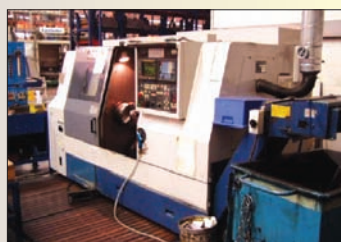
Tour MORI SEIKI SL25MC Axe C outils motorisés FANUC OTC