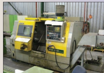
Tour MORI SEIKI SL 25 300 x 600 FANUC OT Embarreur IRCO