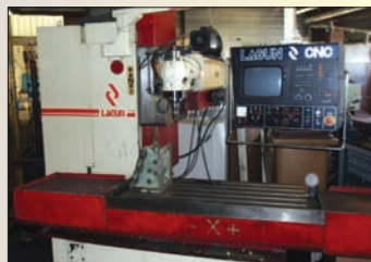
Fraiseuse LAGUN FBF 1200 100 x 600 x 600 HEIDENHAIN TNC 355