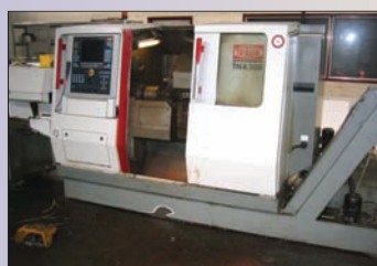
Tour TRAUB TNA 300 Axe C Convoyeur magasin à barre Ø 350 x 700 EP - TBE