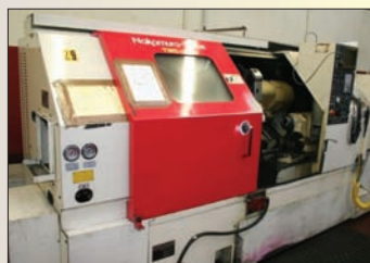
Tour CNC NAKAMURA Type TMC 30 - VDI40 Année 1995 Convoyeur à copeaux