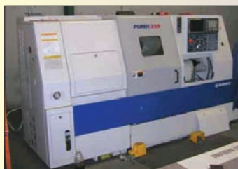
Tour CNC DAEWOO PUMA 230 C de 1998 - Ø 300 x 550 FANUC OTC Convoyeur à copeaux