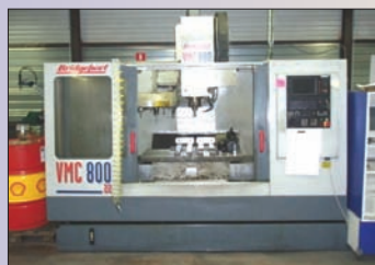
Centre Vertical BRIDGEFORT Type VMC 800/22 Année 1996