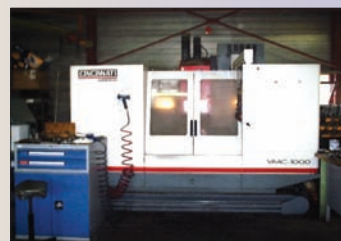
Centre d'usinage vertical CINCINNATI ARROW 1000 de 1998, TNC 426 HEIDENHAIN, 1000 x 500 x 560 - TBE