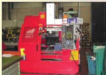
Centre Vertical MATSUURA Type FX 4ème axe LEHMANN