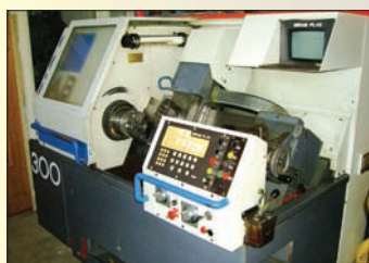
UNIMAB 300 EP 500 - Bon état Mandrin Ø 200 - Multifix avec de nombreux porte outils