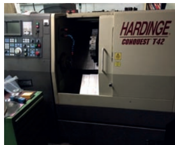
AV Tour HARDINGE Conquest T42 2002 - Fanuc 21T - Passage en broche Dia : 42 - Tél : 03 88 72 02 47