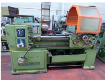
AV Tour conventionnel CAZENEUVE Type HB 575 - Entrepointe : 1000 mm Lunette fixe - Tél : 05 61 78 85 85