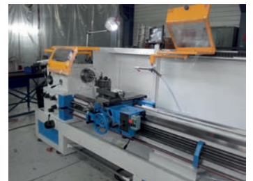
AV Tour RAMO T36 ET - Entre pointes : 600 mm - ø maxi sur le banc : 360 mm ø maxi au dessus du trainard : 180 mm Contrepointe CM4 - Tél : 03 89 81 71 67