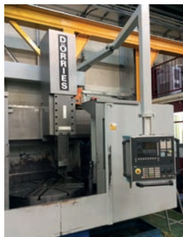
AV Tour vertical DORRIÉS - Plateau : 1200 mm - Changeur d'outils - CNC Siemens - Tél : 06 63 65 11 01