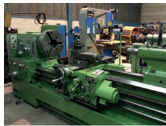
AV Tour GEMINIS GE 680 x 1500 mm Visue - Tél : 06 63 65 11 01