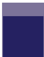
1 ère de couverture 210 x 240