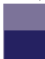
1/2 page 190 x 138,5