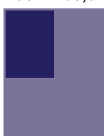
1/4 page 95 x 138,5