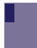
1/3 de colonne 45 x 92,30