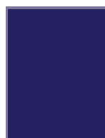
4 ème de couverture 210 x 297