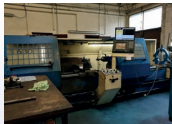
Tour CNC VOJUS TURNTEC 63 x 3000 MMhh Dia 630 x 3000 mm Lunette Siemens 840 D Shop Turn