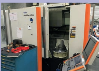
CU 5 axes MIKRON HPM 450 De 2012 Courses 540 x 450 x 400 Broche 20 000 trs/min Heidenhain ITNC 530 Magasin 7 palettes de 450 x 450