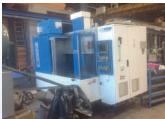
CUV HURON KX 8 De 2002 CNC Heidenhain TNC 426 Courses 800 x 700 x 500 Très bonne machine