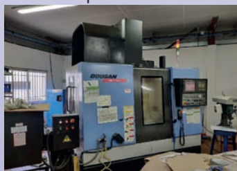
CUV DOOSAN DAEWOO Type NM 410 HS de 2008 Courses 762 x 410 x 510 Broche 20 000 tr/min CNC Fanuc 21 IMB