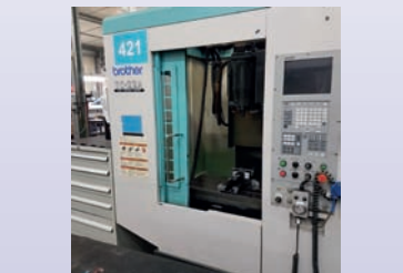
CUV BROTHER TC22A Commande Brother CNC A00 - Année 1999 Table 400 x 650 mm - Courses 500 x 400 x 410 mm - Broche BT 30 - 12 000 tr/mn - Magasin 25 outils - Diviseur 4 ème axe continu Nikken Plateau 220 mm - Manivelle électronique