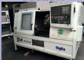
Tour CNC BIGLIA B 501 M De 2001 CNC Fanuc 21 T Axe C Outil motorisé