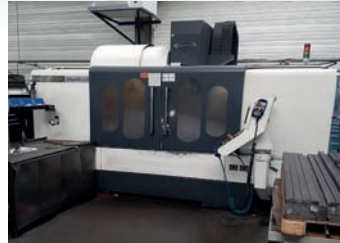
CUV HARTFORD VMC 1270 De 2011 Avec diviseur 4 ème axe CNC Fanuc 21 M