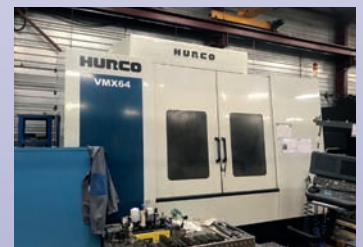
CUV HURCO VMX 64 De 2004 Courses 1600 x 800 x 700