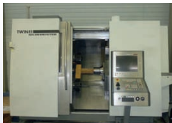
Tour CNC GILDEMEISTER Twin 32 De 2007 Avec LNS CNC Siemens 840 D