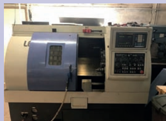
Tour CNC LEADWELL T6 De 2000 CNC Fanuc Dia 220 x 410 EP