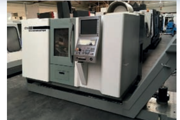
Tour CNC DMG CTX 210 De 2006 3 axes - CNC Heidenhain Dia 220 x 550 ep TBE