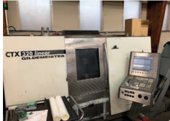
Tour CNC DMG CTX 320 V6 Avec axe Y - Outils motorisés Dia 250 x 700 mm CNC Siemens 840 TBE