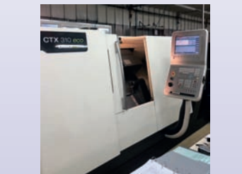
Tour CNC DMG CTX 310 ECO De 2012 Dia 290 x 500 mm CNC Siemens 840 D Etat proche du neuf