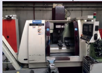
CUV CHEVALIER VMC 2040 De 2000 Courses 1020 x 510 x 510 CNC Siemens 810 D