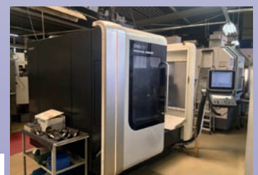
CU DMU 50 - 5 axes De 2010 CNC Mill Plus Courses 500 x 450 x 400 10 000 tr/min - ISO 40