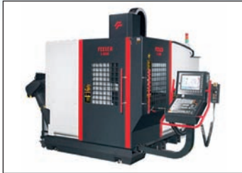
CU 5 axes FEELER U 600 De 2014 CNC Heidenhain ITNC 530 Courses 500 x 500 x 500