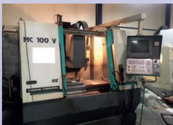
CUV TRENDS TOS MC 100 V De 1998 TNC 426 Heidenhain 1000 x 600 x 600 mm