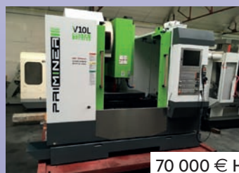
CUV PRIMINER DELTA V 10 L De 2017 Courses 1050 x 520 x 550 - HP CNC Heidenhain TNC 620 Machine neuve avec garantie 1 an