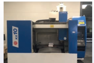
CUV HURON KX 10 De 2007 Courses 1000 x 700 x 550 CNC Siemens 840 D Shopmill