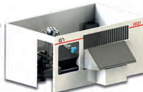
RD21, robot de détourage

Construite sur structure LUCAS SR 21 petite sœur de la SR 32