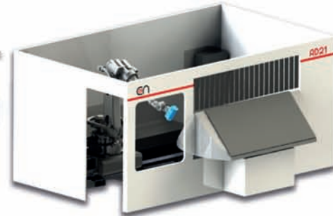
RD21, robot de détourage

Construite sur structure LUCAS SR 21 petite sœur de la SR 32