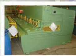
Cisaille SAGITA 3000x6