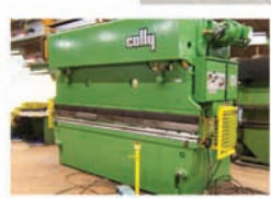
Presse-plieuse COLLY I206S