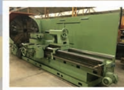
Tour TACCHI FTAS1