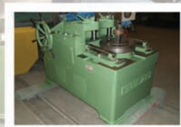
Cintreuse SOCAD CP 13-8