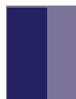
1/2 page 95 x 277