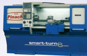
SMART TURN 6 - FANUC Oi MATE TC Tourelle axe vertical 4 positions