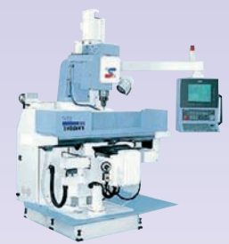
FRAISEUSE BATI CNC VB 600