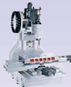
BATI CENTRE USINAGE VP 1100

ø usinage : 200 à 350 mm Tourelle 8 à 12 postes Axe C - outils tournants