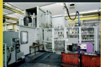
309450 - C.U. PEGARD