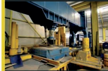
218509 - P. BOLDRINII