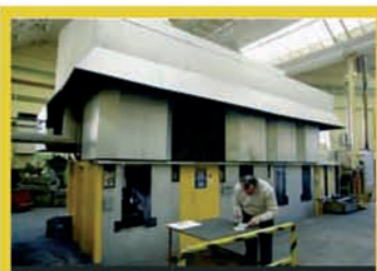
309360 - Four SOLO

Presse hydraulique BOLDRINI pour fonds de cuve, diam.7000 mm. Maxi. - Bordeuse de fonds de cuve, moulureuse BOMBLED - Scie à ruban pour plaques acier et inox PEHAKA table 6000x4000 mm. - Scie à ruban métal. Autom. avec aménagement EVERYSING, H. 300 mm. - Banc d'oxycoupage CNC à plasma sous Vortex d'eau MAINOX - Presse plieuse COLLY 140 T.x 3000 mm. - Cisailles PROMECAM 4000 x16, SAGITA 3100 x10, BOMBLED 3000x6 mm. - 2 Rouleuses 2050 x 12 et 2000 x 2 mm., poinçonneuses VERNET, GEKA,