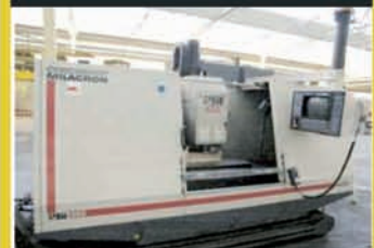
309456 - CINCINNATI