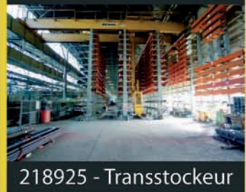
218925 - Transstockeur

Grignoteuse FAVRIN, Encocheuse COMALA 2 perceuses radiales STANKO, 2 M57 et 2 K52 Martinet, Cisaille manuelle, Positionneur, 17 Postes et Presses à souder de tous types, Positionneurs, robots, Plasma, 50 Transfos, 2 Centres d'usinage Flexivit PEGARD de 2001 + 24 Palettes : courses XYZ : 3000x2000x1750 mm. Fraiseuse à portique CNC à 2 broches FOREST LINE 212, - C.U. CINCINNATI SABRE 1000 et 701 palettisé - Taraudeuses, perceuses sur colonnes et sur socles magnétiques HÜLLER, STANKO SCHLUMBER- GER, GSP - 4 Tours SOMAB 300, 400, TITAN et RAMO - Centre de perçage horizontal SOMEX - 2 affûteuses d'outils SAACKE CNC 3 Fraiseuses DUFOUR F250, CNC, F 59 et UNITECH FW 400 CNC - Aléseuse SCHARMANN - pointeuse SIP - 5 Traitements thermiques sous atmosphères SOLO, UGINE, trempe par induction - 3 Machines à laver par aspersion, solvants et ultrasons - Presse de découpe 100T. KAISER 700 cps/mn. - 2 Ebavureuses TROWAL - 2 Dépoussiéreurs par voie humide - Métrologie, 2 4 Marbres et 4 bancs de contrôle, outillages machi- ne- 30 Potences et 3 poutres et ponts roulants DEWET/DEMAG - 4 Tables élévatoires, 5 Chariots élévateurs 2 à 5T. - transstockeur, semi-auto pour métaux en barres ou profils de 6,5 m. Coffres mobiles et rateliers en épis, charge admissible 750 Kg par niveau, 4352 positions - Visible en fonctionnement, plans et vidéo sur demande.