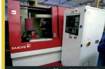
309388 - Affut. SAACKE