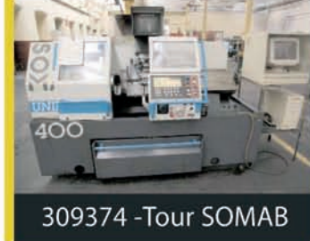
309374 - Tour SOMAB

Par les Ministères de Maîtres : TRESCH & THUET, notaires à 68100 MULHOUSE Maîtres LOMBRAIL & TEUCQUAM, Commissaires-Priseurs à 94210 LA VARENNE-St-HILAIRE Maîtres ALBERT & THUET, Huissiers de Justice à 57500 SAINT AVOLD