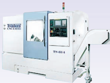
TOUR DE PRODUCTION TS 814 Axe C - outils tournants récupérateur de pièces - convoyeur

Présent aux Salons : SIMODEC : Hall A - Stand D30 INDUSTRIE PARIS : Hall 6 - Stand M100