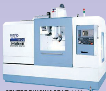
CENTRE D'USINAGE VP 1100