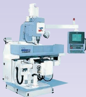
FRAISEUSE CNC VB 600