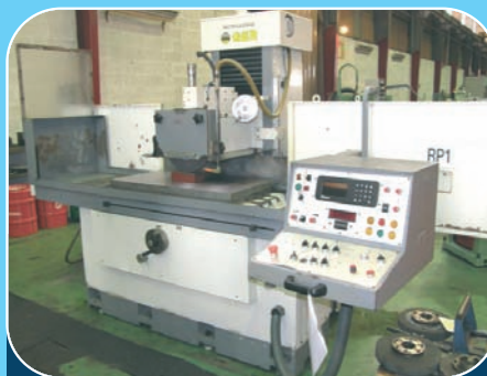
Rectifieuse plane GER RS 10/50 (1991) Plateau magnétique : I 000 x 500 - 3 axes auto diamantage auto