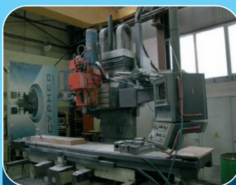
Fraiseuse banc fixe RAMBAUDI RAMMATIC 800 (1991) avec CNC FIFIA FNC 260 Courses : X 2 000, Y 800, Z 800 Table : 3 600 x 800 mm - Changeur 30 outils