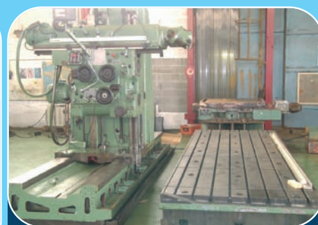
Fraiseuse banc fixe HURON LU X 3 000 Y I 000 Z 100 - Visu 3 axes Graissage centralisé