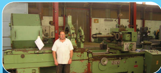
Rectifieuse Cyl. d'inter WOTAN S308 I3L15 ø à rectifier : 700 mm - Profondeur de rectification : 800 mm ø sur banc : I 200 mm