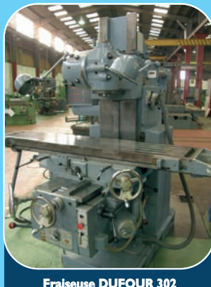
Fraiseuse DUFOUR 302 Courses : X I 300, Y 400, Z 550 Table : I 800 x 400 Visu 3 axes HEIDENHAIN + étau hydraulique SAGOP