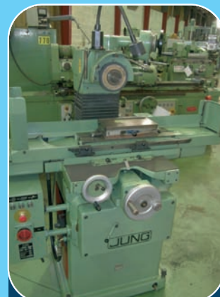
Rectifieuse plane JUNG HF400 Plateau magnétique : 255 x 130 mm