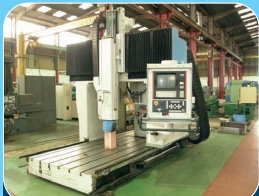
Fraiseuse à portique 5 axes continus JOB JOMACH 21 (1990) avec CNC NUM 1040 Courses : X 2 500, Y I 600, Z 900 - Table : 4 000 x I 500 mm Tête axe A 220° + axe C 400° - Broche 7,5 kW à 18 000 t/mn