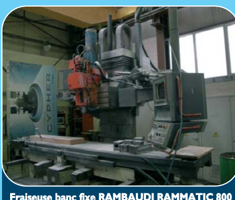
Fraiseuse banc fixe RAMBAUDI RAMMATIC 800 (1991) avec CNC FIFIA FNC 260 Courses : X 2 000, Y 800, Z 800 Table : 3 600 x 800 mm - Changeur 30 outils