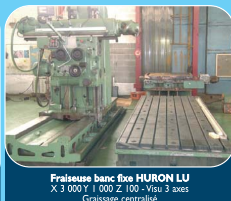
Fraiseuse banc fixe HURON LU X 3 000 Y 1 000 Z 100 - Visu 3 axes Graissage centralisé