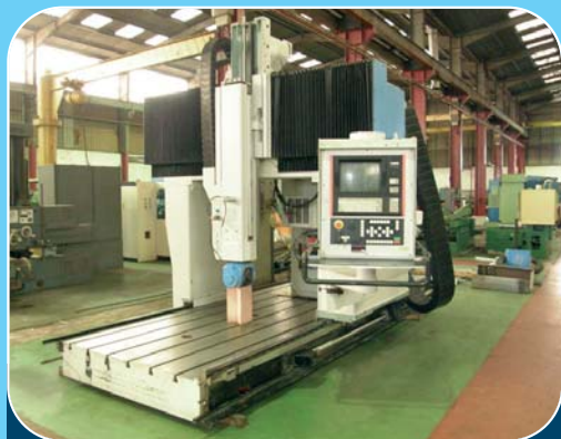
Fraiseuse à portique 5 axes continus JOB JOMACH 21 (1990) avec CNC NUM 1040 Courses : X 2 500, Y 1 600, Z 900 - Table : 4 000 x 1 500 mm Tête axe A 220° + axe C 400° - Broche 7,5 kW à 18 000 t/mn