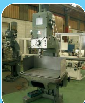
Perceuse SCHULMBERGER PC 2 Cône CM 4 - Table 1 000 x 400