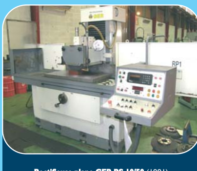
Rectifreuse plane GER RS 10/50 (1991) Plateau magnétique : 1 000 x 500 - 3 axes auto Diamantage auto