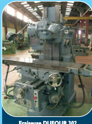
Fraiseuse DUFOR 302 Courses : X 1 300, Y 400, Z 550 Table : 1 800 x 400 Visu 3 axes HEIDENHAIN + étau hydraulique SAGOP