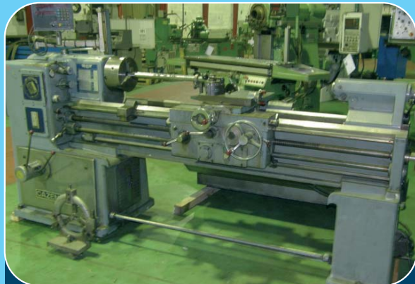
Tour CAZENEUVE HB 500 x 1 500 Diam sur banc : 500 mm - EP : 1 500 Visu 2 axes + tourelle MULTIFIX + Lunette