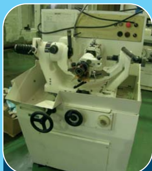
Affuteuse AVYAC 3P32 Diamètre mini-maxi : 3-32 mm Longueur max : 450 mm Angle d'affutage : 90° à 180°