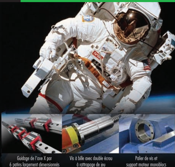
Guidage de l'axe X par 6 patins largement dimensionnés