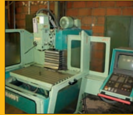
Fraiseuse MAHO MH 600 T CNC HEIDENHAIN 232 Courses : 0,6 / 0,450 / 0,450 mm Changeur