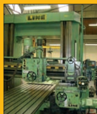
Fraiseuse à portique LINÉ Conventionnelle Course X : 6 m - Entre montants : 2 m - 3 Têtes 22 Kw