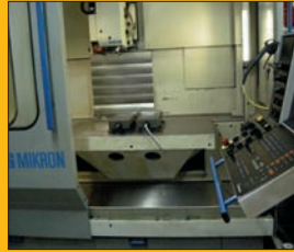
Fraiseuse MIKRON UMS 710 CNC HEIDENHAIN 426 Courses : 710 / 630 / 500 mm Changeur