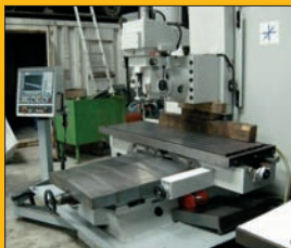
Fraiseuse CHALLENGER MB 30 CNC FAGOR 8055 Courses : 1524 / 762 / 711 mm 1 tête 7,5 CV

CONSULTEZ NOTRE SITE : www.machines-service.fr