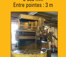
Tour vertical SCHIESS EK 160 ø maxi : 1,8 m