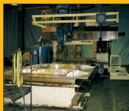
Fraiseuse portique FOREST LINÉ SERAMILL 240 Courses : 8 / 2,5 / 0,950 m 5 axes - CNC au choix