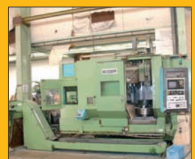
Tour vertical CNC HESSAP ø 1080 mm - 2 changeurs Avec outils de tournage et fraisage