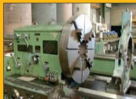
Tour CNC STANKO CNC HEIDENHAIN MANUEL PLUS - ø 1,2 m Entre pointes : 5 m - En cours de retrofit complet