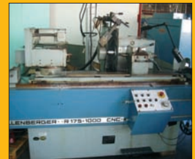
Rectifieuse KELLENBERGER R 175 CNC extér ø 349 mm - Entre pointes : 1000 mm