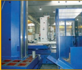
Aléuseuse CNC TOS WHN 13.8 ø 130 mm CNC HEIDENHAIN 530 Courses : 3,5 / 2 / 1,25 m

Tél. : 01 47 81 47 38 - Fax : 01 47 84 66 22 - E-mail : machines-service@wanadoo.fr