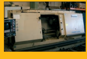
Tour CNC DANOBAT NUM 1060 ø 400 mm - Longueur de travail : 1547 mm - Tourelle 12 outils Puissance : 30 Kw