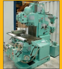
Fraiseuse DUFOUR 225 Conventionnelle Courses : 0,750 / 0,300 / 0,470 mm