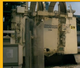
Fraiseuse portique CINCINNATI CNC NUM 1060 5 axes - Courses : 8 / 2,2 / 0,5 m 1 Tête 22 Kw