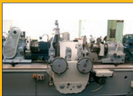
Rectifieuse de vilebrequin VAN NORMAN ø 700 mm Entre pointes : 2 m