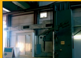
Rectifieuse verticale SIELEMANN ø 2 m Cours du coulant de rectification : 1,4 m