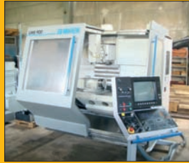
Fraiseuse MIKRON UMS 900 CNC HEIDENHAIN 426 Courses : 0,9 / 0,630 / 0,500 m 4 axes - Changeur