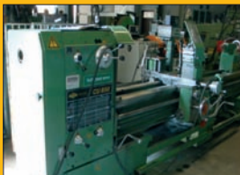
Tour parallèle ZMM chariotier fileter ø 850 mm Entre pointes : 3 m