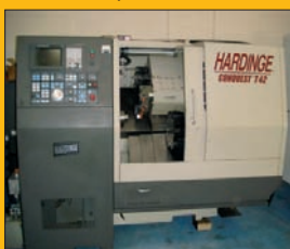
Tour CNC HARDINGE CONQUEST 42 - CNC FANUC ø 42 mm - 2 tourelles