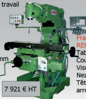
Table : 1120 x 280 mm Courses XYZ : 600 x 280 x 400 mm Visualisation numérique 3 axes Nez de broche : SA40 Broches horizontale et verticale, accessoires, arrosage