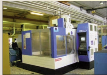
HURON KX 20 - Année 2000 1 200 x 1 000 x 550 CNC Siemens 840D Broche 24 000 tr/min