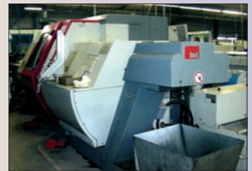
Tour CNC GILDEMEISTER TWIN 65 Bibroche - Passage 65 en barre Outils motorisés - 2 tourelles Convoyeur - A saisir