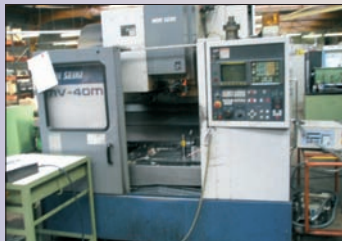
MORI SEIKI MV 40 CNC Fanuc 800 x 500 x 500