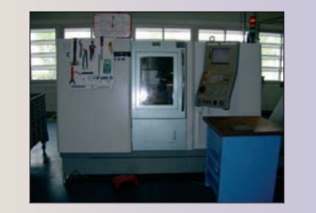
GILDEMEISTER CTX 210 V2 Année 2003 CNC Fanuc - 210 x 500 TBE - Prix : 32 000 Euros