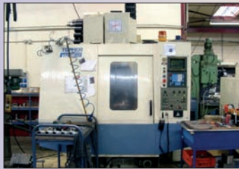
Centre d'usinage vertical TOPPER TMV 760 - Année 1997 Fanuc OMC 760 x 450 x 510 Arrosage centre broche 15 bar