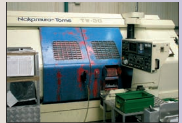
Tour CNC bibroche NAKAMURA TW 30 Axe C - Magasin à barre IEMCA TAL 65 - Fanuc OTT