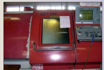
Tour GILDEMEISTER CTX 400 Outils motorisés CNC manuel Turn HEIDENHAIN Prix intéressant

7, rue du Bosquet - 67590 SCHWEIGHOUSE-SUR-MODER Tél. 03.88.72.02.47 - Fax 03.88.72.02.94 E-mail : fimotec@wanadoo.fr - Site internet : www.fimotec.fr