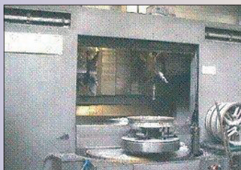
Tour vertical IMT W 20/4 Année 1997 - Fanuc OTTC Dia maxi 640 x H 200 mm 2 tourelles - 6 positions - Bon état