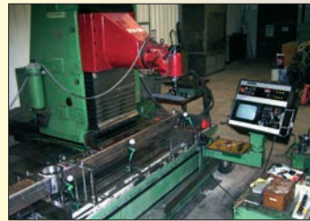
Fraiseuse ANAYAK VHM 3800 TNC 355 Courses : 3 300 x 1 000 x 1 000 Table 4 axes intégrés