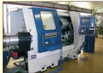
Tour CNC DAEWOO PUMA 8 HC 3 A TBE - Fanuc 15 TF conversationnel Axe C - Outils motorisés LNS Magasin à barre