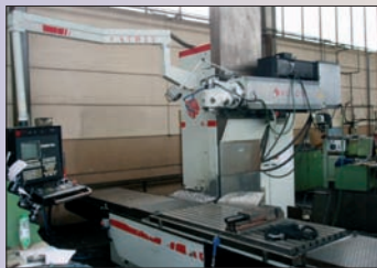
Fraiseuse CNC HURON SXB 523 1 800 x 730 x 1 000 - CNC NUM 750 Bon état + Portes outils ISO 50