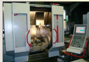
Centre 5 axes HERMLE C 30 U Année 2005 Heidenhain ITNC 530 Courses : 650 x 600 x 500 - TBE