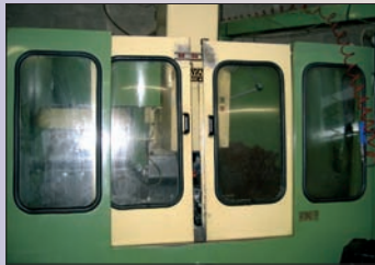
Centre d'usinage vertical ANAYACK ANAMATIC 6 800 x 600 x 600 - CNC Fanuc TBE - Prix : 13 000 Euros HT