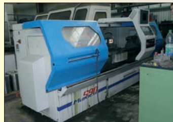
Tour CAZENEUVE MAXICAP 520 x 2 000 Année 2001 - CNC Somap SP 5S Bon état