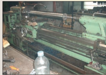
Tour CAZENEUVE HB 725 x 4 000 BE Visu Avance rapide - Bon État