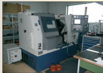
Tour CNC MORI SEIKI SL 150 Fanuc 18I Dia 280 x 500 - TBE