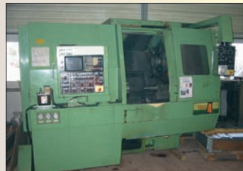
Tour CNC NAKAMURA ST 4 Dia 690 x 1 040 - Fanuc 6T Convoyeur à copeaux - Petit prix