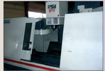
Centre d'usinage vertical CINCINNATI Sabre 1000 Heidenhain TNC 415 100 x 510 x 510 - BE