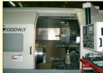
Tour CNC GOODWAY GS 460 Année 2003 - Fanuc 21 Dia 710 x EP 1 000 - Lunette program- mable - TBE - Disponible de suite