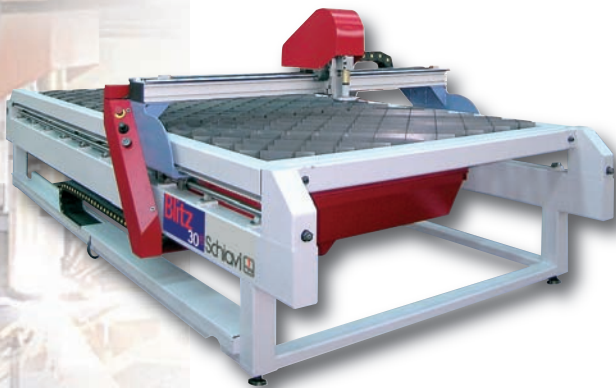
o Découpe plasma et poinçonnage - grignotage à CN