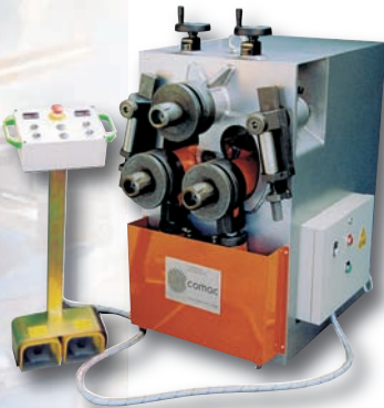
o Cintrage universel