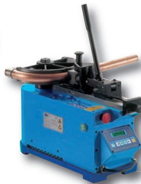
o Cintrage à rayons courts