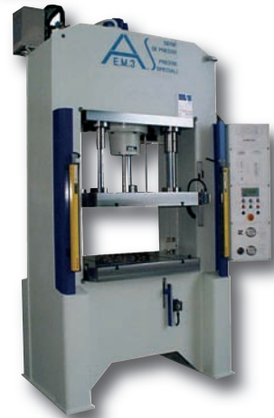
o Presses hydrauliques