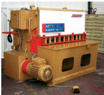
AV Cisaille guillotine SAGITA - 1 550 x 16 mm - Butée arrière électrique - Réf. 4368 Contact : +33 556 57 01 22