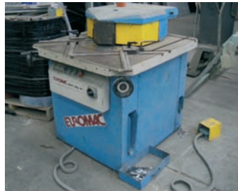
AV Encocheuse / grugeuse hydraulique EUROMAC MULTI 220/6 VA - Capacités : 220 x 6 mm - Angle variable de 30° à 140° - Contact : 06 18 37 68 26