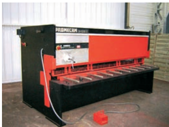
AV Cisaille guillotine AMADA PROMECAM - 3 100 x 10 mm - GH 1030 Z - Butée arrière électrique Contact : +33 556 57 01 22