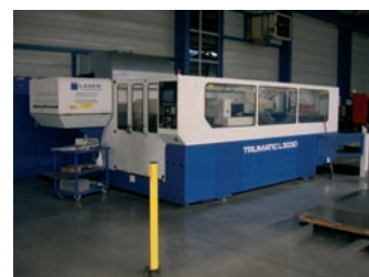
AV Découpe laser TRUMPF TL 3030 2 200 W - 3 000 x 1 500 mm Tél : 06 84 78 75 48