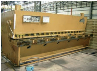
AV Cisaille guillotine COLLY - 4 000 x 10 mm - Butée arrière électrique - Réf. 4505 Contact : +33 556 57 01 22