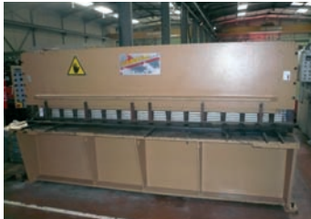
AV Cisaille guillotine COMETAL CGHS Cap : 3 000 x 8 mm Tél : 04 78 79 05 10