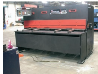
AV Cisaille AMADA GPS 420 Tél : 06 84 78 75 48