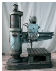
Perceuse GRAFFENSTADEN Longueur du bras : 1 000 mm ø 55 mm 8 000€ - 2 500€