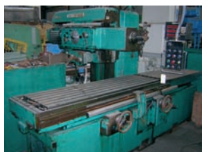
Fraiseuse GRAFFENSTADEN Type FB 616 SD 1 600 x 630 x 1 000 mm Avec tête de fraisage - Visu 3 axes 15 000€ - 8 000€