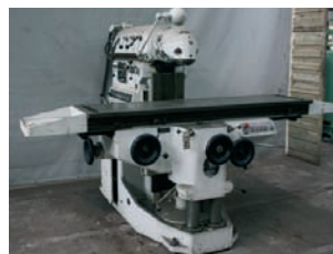
Fraiseuse HURON Type MU6 1 500 x 700 x 550 mm 7 500€ - 6 000€