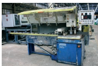
Tronçonneuse / Scie KASTO Type KKS 400 AU CNC 2 000€ - 1 000€