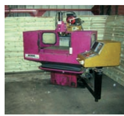
Fraiseuse ACIERA Type F450 APM 800 x 450 x 450 mm CNC 3 axes 11 000€ - 4 500€