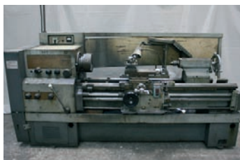
Tour parallèle STANKO ø 700 x 1 500 mm 6 000€ - 2 500€