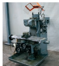
Fraiseuse ALCERA 780 x 250 x 420 mm 4 800€ - 2 500€