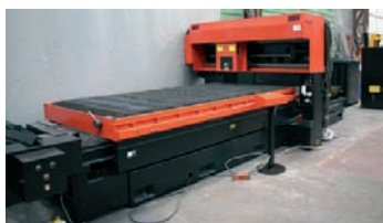
Laser AMADA Type LCV 6612 II 2000 watts - 3 070 x 1 550 mm CNC Fanuc 80 000€ - 20 000€