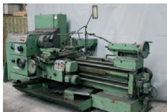
Tour parallèle SCHÄRRER 800 x 1 500 mm 5 000€ - 1 000€