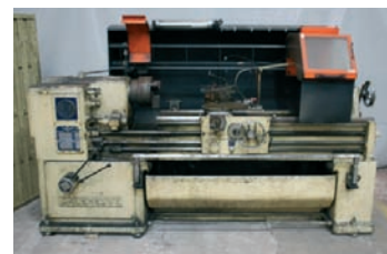
Tour parallèle CAZENEUVE Type HB 500 ø 500 x 1 500 mm 7 500€ - 4 000€