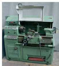
Tour parallèle RAMO Type 37 ø 200 x 580 mm 5 000€ - 2 300€