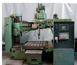
Perceuse GSP Type 45FP10 N12 1 200 x 1 000 mm CN Num 720 11 000€ - 4 500€