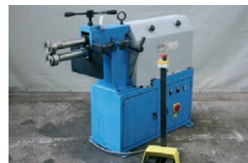
Bordeuse AKYPAK Type AKM 250 2,5 mm 4 000€ - 2 500€