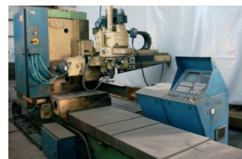
Perceuse GSP Type 45FM12 3 000 x 1 200 mm CN Num 750 18 000€ - 6 000€