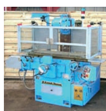
Fraiseuse ERNAULT SOMUA Type ZI C 710 x 250 x 400 mm 4 000€ - 2 300€