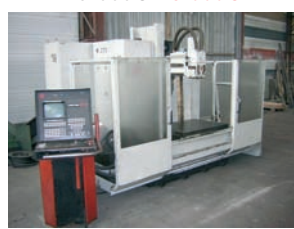
Fraiseuse HURON Type FX 900 x 520 x 660 mm CNC Num 750 8 000€ - 7 500€