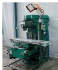
Fraiseuse GAMBIN Type IM 750 x 250 x 500 mm 1 500€ - 800€