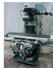
Fraiseuse GAMBIN Type I1M 800 x 300 x 630 mm 4 500€ - 3 000€