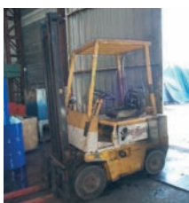
Chariot élévateur FENWICK Gasoil - IT5 4 300€ - 1 500€

Plus de 50 machines à prix cassés à l'étiquette !