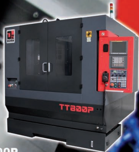
TT800P Surface de table: 850 x 500 mm

RAPIDES JUSQU'A 60 m/mn BROCHE DIRECTE JUSQU'A 20000 t/mn CHANGEUR D'OUTILS 0,7 SEC JUSQU'A 2G D'ACCÉLÉRATION