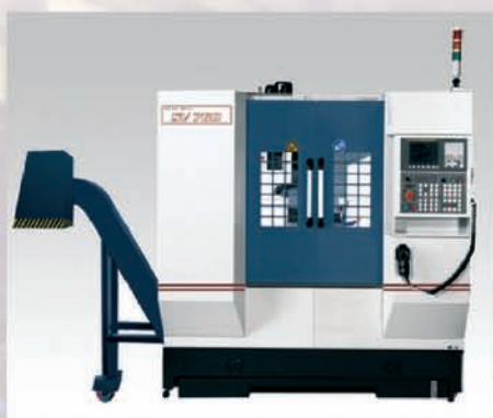
CU AKIRA SEIKI V2.5 XP 4 axes