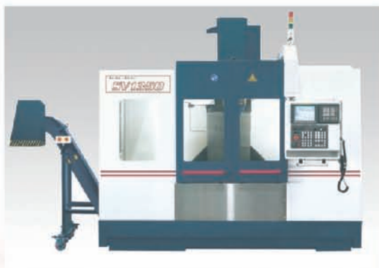
CU AKIRA SEIKI V4.5 XP