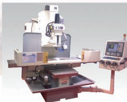
FRAISEUSE D'OUTILLAGE CN L&W CiNCH 25T