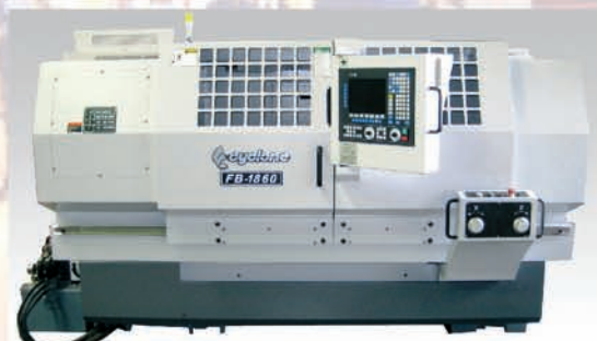
TOUR APPRENTISSAGE CN L&W FB 1860