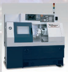
TOUR CN AKIRA SEIKI SL20