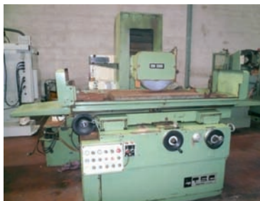
AV Rectifieuse TSC - 1 000 x 500 mm Tél : 04 78 79 05 10