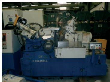
AV Rectifieuse centerless CINCINNATI 3/500 Twin Grip - CNC Num - 4 axes Tél : 06 63 65 11 01