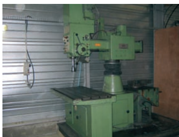
AV Superbe perceuse radiale HKS 40 - Visu Année 1989 - TB état - Tél : 06 75 49 39 37 E-mail : ph.geof@orange.fr