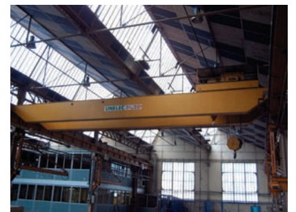
UNELEC 20/5 T.