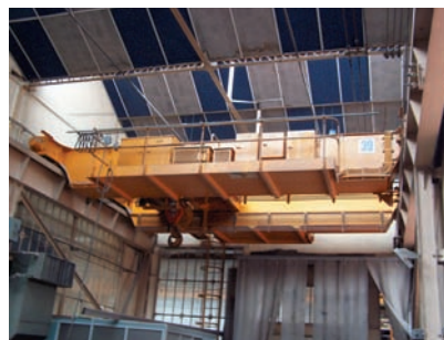
UNELEC 40 T.

Pont roulant UNELEC 40 T., bipoutre, portée 8.850 mm Pont roulant UNELEC 30/5 T., bipoutre, portée 14.200 mm Pont roulant UNELEC 20/5 T., bipoutre, portée 14.200 mm Pont roulant LAM 10 T., bipoutre, portée 14.200 mm (2 ponts disponibles) Pont roulant UNELEC 5 T., portée 14.200 mm Pont roulant LAM 1 T., portée 8.850 mm