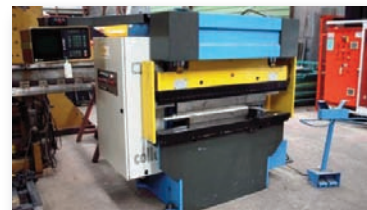
Presse plieuse COLLY - PS PRO 25/15 25T x 1500 mm - CNC 3 axes