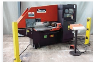
Poinçonneuse CN AMADA - ARIES 222 20 T - 600 x 600 mm - Tourelle 10 outils