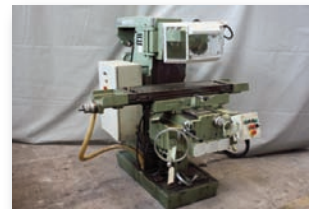
Fraiseuse VERNIER - FV270 800 x 270 x 450 mm