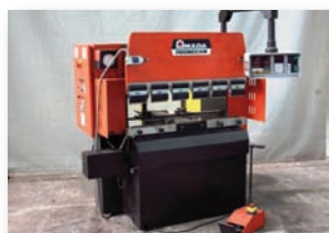
Presse plieuse AMADA PROMECAM RG 25/12 25T x 1250 mm - CN 2 axes