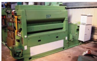
Planeuse LISSE - 9.63 1600 x 5 mm - 9 rouleaux