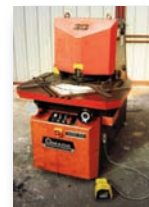
Encocheuse AMADA PROMECAM VERSA 204 220 x 4 mm - Angle variable