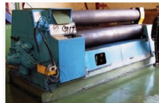
Rouleuse croqueuse PULLMAX - PV7H 2500 x 25/30 mm - 3 rouleaux - Hydraulique