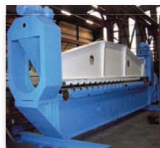
Rouleuse FARNHAM 6000 x 3/4 mm - 3 rouleaux - Spécial aéro