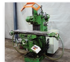
Fraiseuse DUFOUR - 194 860 x 330 x 435 mm