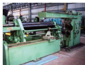
Machine à faire tomber les bords BOLDRINI - RIBO12/4000 4000 x 12 mm - Avec accessoires