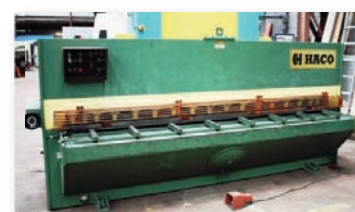
Cisaille guillotine HACO - TS 306 3000 x 6 mm - Butée arrière électrique