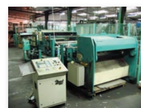
Ligne de déroulage / refendage IMRD 1580 x 3 mm - CNC