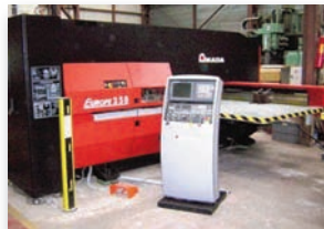
Poinçonneuse CN AMADA EUROPE 258 20 T - 1270 x 2000 mm - Tourelle 31 outils dont 3 auto index