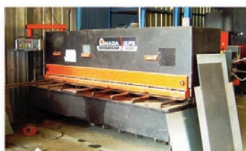
Cisaille guillotine AMADA PROMECAM GPX 630 3000 x 6 mm - CN - Soutien de tôle arrière