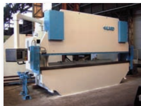
Presse plieuse LYD 160 T x 5100 mm - CNC 4 axes