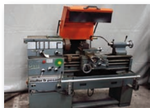
Tour parallèle MULLER ET PESANT CELTIC 14 ø usinable 550 mm - Entre pointe 830 mm