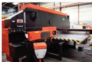
Poinçonneuse CN AMADA - VIPROS 367 30 T - 1525 x 1780 mm - Tourelle 44 outils dont 2 auto index