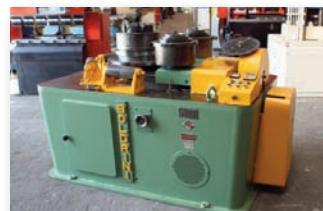
Cintreuse à galets BOLDRINI - BSA16M Capacité cornière 100 mm