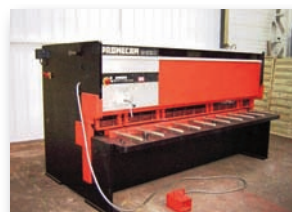
Cisaille guillotine AMADA PROMECAM GH 1030 3000 x 10 mm - Butée arrière électrique