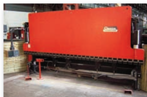
Presse plieuse AMADA PROMECAM STPC 206 200 T x 6000 mm - CNC 4 axes