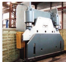
Presse plieuse CINCINNATI - H400 400 T x 3500 mm