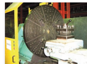
Tour SCULFORT - SUPERCAP 750R x 3000 ø usinable 1500 mm - Entre pointe 3000