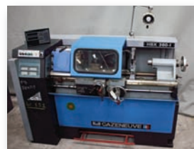
Tour parallèle CAZENEUVE - HBX 360 ø usinable 360 mm - Entre pointe 800 mm