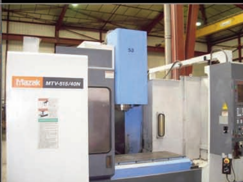
Centre vertical MAZAK MTV 515 / 40

Année 2008. Armoire FANUC. Course X, Z : 215, 508 mm. Embarreur SERVO BAR 300.