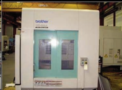
Centre BROTHER TC 32B-FT 5S

Année 1997. Armoire M+. Course X, Y, Z : 1050, 510, 550 mm. Broche 6 000 trm. Arrosage centre broche. Magasin 30 outils type CAT 50.