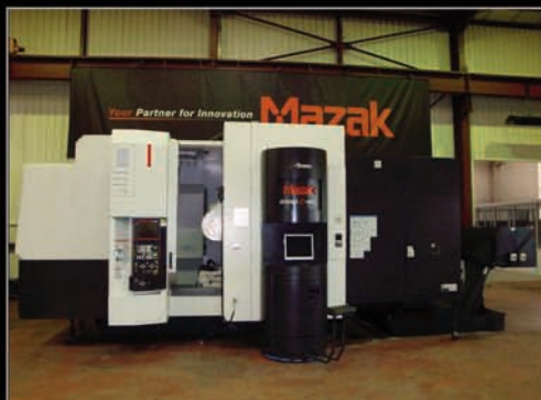
Centre de tournage vertical / Broche de fraisage 5 axes MAZAK Type e 800 Année 2006. CNC Fusion 640 M Pro Dia. Maxi usinable : 730 mm. Vitesse broche tournage 1 000 tr/min 22 kW Vitesse broche fraisage : 12 000 tr/min 22 kW Magasin 80 outils Capto C6.