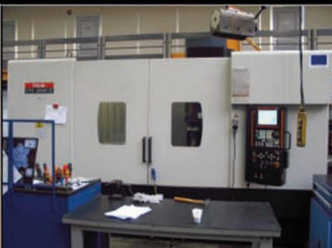
Centre vertical MAZAK type VTC 300 C Année 2008. Armoire FUSION 640 M Course X, Y, Z : 1740, 760, 660 mm. Broche 12 000 trm 18,5 kW. Arrosage centre broche. Magasin 30 outils .