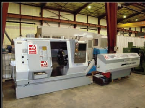
Tour CN 2 axes Type HAAS SL 20

Année 2008. Armoire FANUC. Course X, Z : 215, 508 mm. Embarreur SERVO BAR 300.