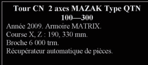
Tour CN 2 axes MAZAK Type QTN 100—300

Année 2007. Plateau 4ème et 5ème axe Diamètre 400 x 400 mm. Broche 16 000 trm. Magasin 16 outils type BT 30. Avance rapide 70 m/min.