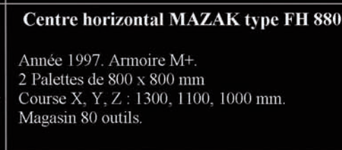
Centre horizontal MAZAK type FH 880

Année 2001. Armoire Fusion 640 M 2 palettes 1000 x 1000 mm. Course X, Y, Z : 1640, 1300, 1220 mm. Magasin 120 outils. 4 ème axe.