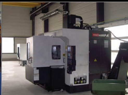
Centre vertical 5 axes MAZAK type VRX 500 Année 2004. Armoire FUSION 640 M. Course X, Y, Z : 510, 510, 460 mm. Broche 12 000 trm. 15 kW. 2 Palettes. Magasin 40 outils.