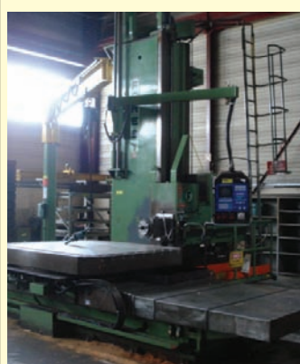
FOREST LINE P 2000 (1978/1986) X = 3.200, Y = 2.500, Z = 800, W = 1.250 mm, table 2.000 x 2.300 mm, B 360.000 positions, charge 15 T, tête de fraisage universelle CORREA, CN NUM 760 5 axes.