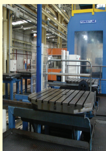
FOREST LINE FLEXIAX 410 (1987) 10 palettes 1.250 x 1.250 mm, X = 2.000, Y = 1.250, Z = 1.250 mm, B 360.000 positions, chang. auto. d'outils 100 positions, palpeur RENISHAW, navette d'approvisionnement, CN NUM 760.