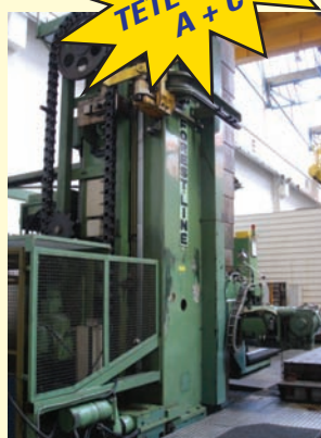
FOREST LINE F 180 JN (1983), Ø broche 180 mm, X = 17.500, Y = 3.500, Z = 1.250, W = 1.000, V = 3.500 mm, table tournante 6.000 x 4.000 mm, B 360.000 positions, charge 45 T, chang. auto. d'outils 80 + 12 positions, CN NUM 760 F.