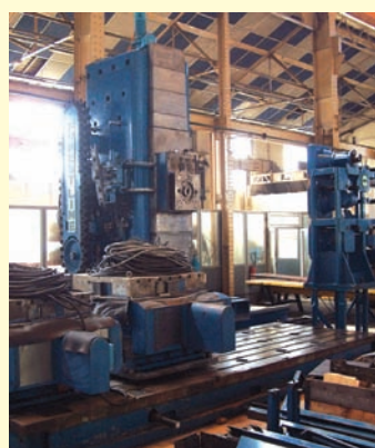
FOREST LINE F 160.50 ALTC (1982/1992) X = 6.300, Y = 2.000, Z = 1.000, W = 800 mm, 2 tables tournantes 360.000 positions 1.100 x 1.100 mm, changeur d'outils et de têtes, CN NUM 760 F.