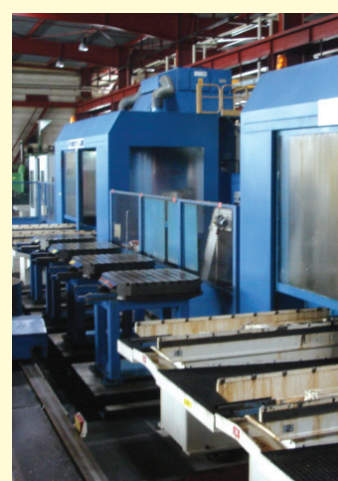
FOREST LINE FLEXIAX 410 FMS (1987), cellule de 2 centres FLEXIAX 410 4 axes, 13 palettes 1.000 x 1.000 mm, 1 navette d'approvisionnement, chang. auto. d'outils 2 x 150 positions, X = 2.000, Y = 1.250, Z = 1.250 mm, B 360.000 positions, palpeur RENISHAW, CN NUM 760.