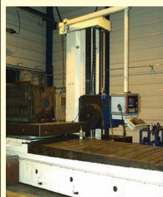
PEGARD AF 110 (1975/2000), X = 3.500, Y = 2.000, Z = 1.500, W = 800 mm, axe B 360.000 positions 2.400 x 1.800 mm, CN NUM 1060 5 axes.