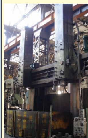
RAFAMET KCF 200 (1969), Ø 2.000 / 2.230 mm, hauteur 1.250 mm, charge 10 T, 4 mors indépendants