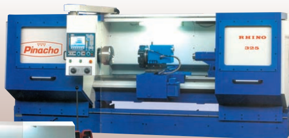
Tour CNC PINACHO RHINO 325 HP : 325 mm - Ø admis sur le banc : 660 mm Ø admis sur le chariot : 585 x 368 mm Largeur du banc : 425 mm