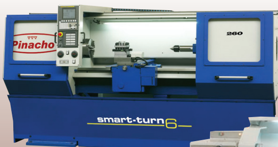
Tour électronique PINACHO SMART 6/260 HP : 260 mm - Ø admis sur le banc : 530 mm Ø admis sur le chariot : 475 x 315 mm Largeur du banc : 350 mm