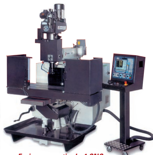
Fraiseuse verticale 4 CNC Table : 1473 x 280 mm - Rainures en "T" : 3 x 16 x 63 mm - Courses : 820 x 455 x 150 mm