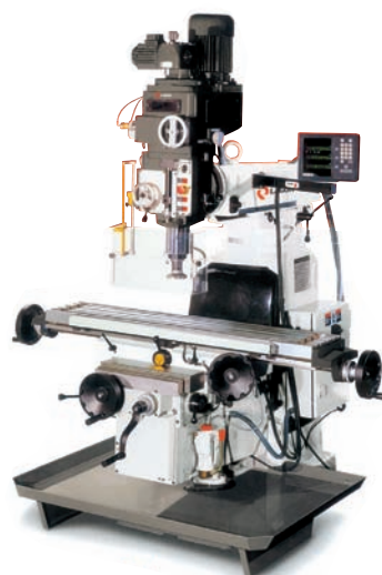
Table : 1372 x 280 mm Rainures en "T" : 3 x 16 x 63 mm Courses : 800 x 345 x 400 mm