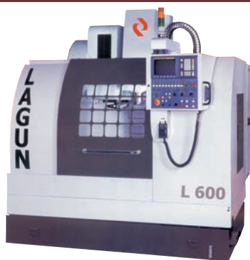
Centre d'usinage vertical L 600 - X 610 - Y 410 - Z 460 L 1000 - X 1000 - Y 500 - Z 500 L 1400 - X 1400 - Y 660 - Z 610 CNC : FAGOR / FANUC / HEIDENHAIN