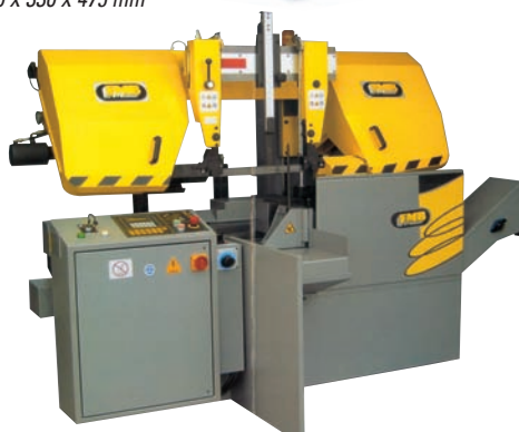
FMB POLARIS Ø 360