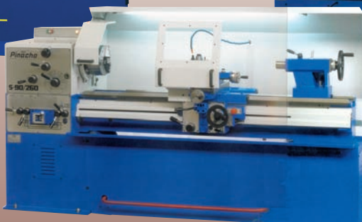
Tour conventionnel PINACHO S90-260 HP : 260 mm - Ø admis sur le banc : 530 mm Ø admis dans le rompu : 780 mm Ø admis sur le chariot : 475 x 325 mm Largeur du banc : 350 mm