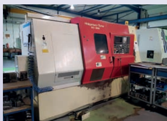
Tour CNC NAKAMURA SC 300 CNC Fanuc 3 axes Outils motorisés TBE