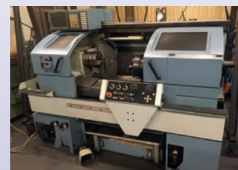
Tour CNC SCHAUBLIN 180 CCN CNC Fanuc Tourelle 8 postes + Multifixe TBE