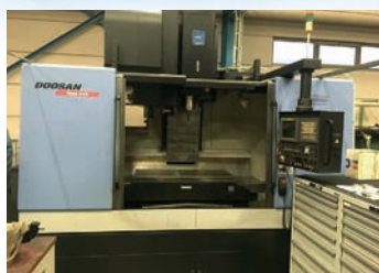
CUV DOOSAN MYNX 540 De 2007 Courses 1050 x 510 x 510 CNC Fanuc 21i T B Superbe état