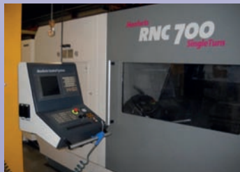
Tour MONFORTS RNC 700 - De 2007 TBE - CNC Fanuc langage Iso et Fapt ø devant le banc 720 mm - ø devant la tourelle 550 mm - Puissance 30/37 kW Longueur usinable 1500 mm - Vitesse 8/4000 rpm - Tourelle 12 outils VDI de 60