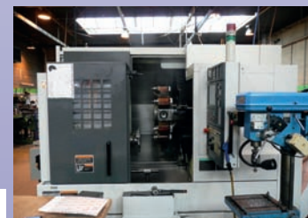
Tour CNC MORI SEIKI NL 2000 Y De 2006 Dia 500 x 510 Courses Axe Y TBE