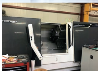
Tour CNC DMG MORI CTX 510 Eco De 2015 4 axes avec axe Y CNC Siemens Comme neuf