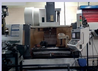
Centre vertical YCM NTV 158 B CNC Fanuc 31 I Courses 1520 x 760 x 700 BT 50 - 22 kw De 2009 - TBE