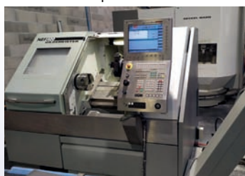
Tour GILDEMEISTER NEF 400 CN Siemens 840D Shop Turn Année 2006 TBE