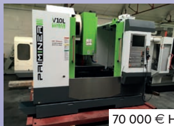
CUV PRIMINER DELTA V 10 L De 2017 Courses 1050 x 520 x 550 - HP CNC Heidenhain TNC 620 Machine neuve avec garantie 1 an