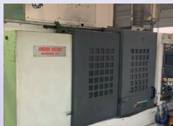
CUV DMG DMC 64 V LINEAR Année 2004 CNC Heidenhain TNC 530 Courses 640 x 600 x 500 mm TBE