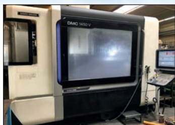
Centre d'usinage vertical DMG DMC 1450 V BAUJAHR 2015 Courses 1400 400 x 550 Commande 3D Siemens 840D Sinumerik