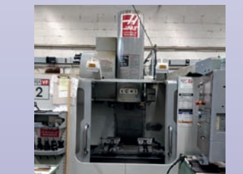
Centre HAAS VF 2 SS HE