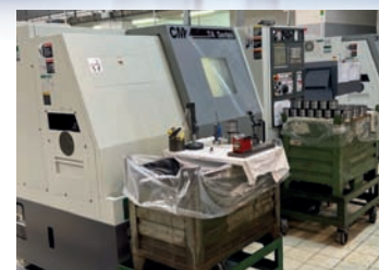
Tour CNC CMZ TA 15 De 2015 Avec outils motorisés + Convoyeur TBE