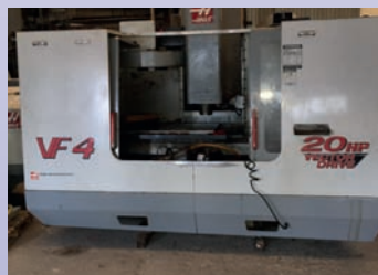
CUV HAAS VF 4 De 2001 Course 1250 X 600 X 600 Bon état