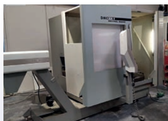
CUV MORI SEIKI NV 5000 De 2006 CNC Fanuc 16 M Courses 1050 x 510 x 510 BT 50