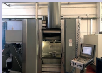
CUV DMG DMC 85 V LINEAR De 2002 Heidenhain iTNC 530 Courses 950 x 630 x 500 Broche 30 000 tr/min