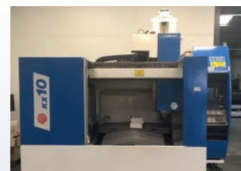
CUV HURON KX 10 De 2007 Courses 1000 x 700 x 550 CNC Siemens 840 D Shopmill