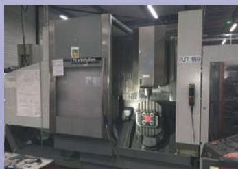
Centre 5 axes DMG DMU 70 Evo De 2003 Heidenhain iTNC 530 Courses 700 x 650 x 500 Broche 18000 t/min