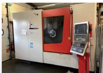
Centre 5 axes SIGMA FLEX 3 De 2015 CNC Siemens Courses 1150 x 600 x 600 TBE