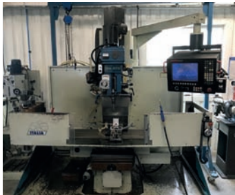
AV Fraiseuse CNC SIA Italie - CNC Anilam - Courses : 700 x 450 x 500 Prix : 6 000 Euros - TBE Tél : 03 88 72 02 47