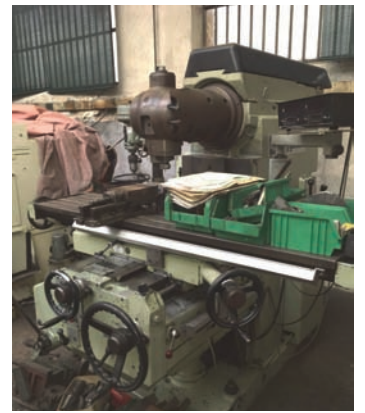
AV Fraiseuse GAMBIN 3 M - Table : 1520 x 385 - Courses : 1000 x 420 x 710 - Bon état - Prix : 4 000 Euros Tél : 03 88 72 02 47