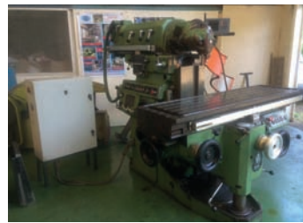
AV Fraiseuse HURON NU5 - Courses : 1300 x 700 x 550 mm - Table : 1635 x 460 mm - Cône de broche : SA40 Visualisation 3 axes Heidenhain Armoire électrique séparée Tél : 06 75 49 57 65