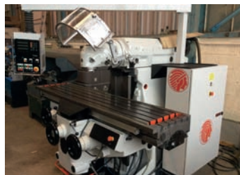
AV Fraiseuse HURON MU6 - Visue Variateur - Table : 2000 x 460 mm Tél : 06 63 65 11 01