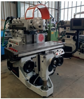
AV Fraiseuse HURON NU4 - Visue Variateur - Courses : 1100 x 700 mm Tél : 06 63 65 11 01