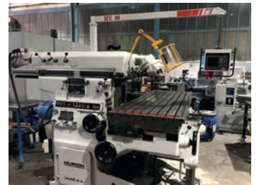
AV Fraiseuse HURON MU66 - Visue Courses : 1500 x 1000 x 550 mm Tél : 06 63 65 11 01