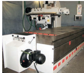
AV Fraiseuse HURON RU 771 - Visue Courses : 2500 x 1000 x 1000 mm Tél : 06 63 65 11 01