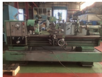
AV Tour parallèle HARRISON M500 x 1500 - ø sur le banc : 530 mm - Alésage de broche : 80 mm - Distance entre pointes : 1500 mm - ø admis dans le rompu : 730 mm - Vitesse de rotation de broche : 31-1600 Tpm - 1 lunette fixe Tél : 06 75 49 57 65