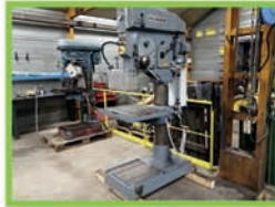
Perceuse GILLARDON GSB 40V