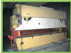
Presse-plieuse COLLY 3014 6000 x 300 T