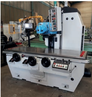
AV Fraiseuse HURON PU771 - Visue Courses : 1900 x 1000 x 1000 mm Tél : 06 63 65 11 01

54 Avenue de la Libération - 10140 Vendeuvre sur Barse