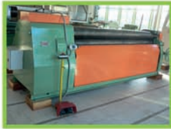
Rouleuse planeuse FASTI RBM 2500 x 6