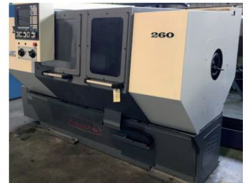
AV Tour CNC par apprentissage PINACHO Smart-Turn 8 260 Commande numérique : par auto apprentissage Fagor 8055 - Année : 2012 - Diamètre sur banc : 530 mm Hauteur de pointes : 260 mm - Longueur entrepointes : 1000 mm - Broche/cône : 5 - Gamme de vitesse de rotation : 0 2500 tr/min - Puissance broche : 17 kW Documentation complète - Tourelle automatique 8 positions - Mandrin 3 mors ø 315 mm - Tél : 04 77 73 00 82