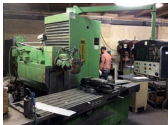
AV Fraiseuse CORREA A16 - Heidenhain TNC 355 - Courses : 1600 x 800 x 800 mm - Tél : 06 63 65 11 01