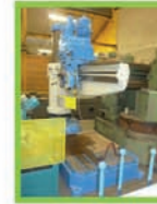
Perceuse radiale CM 5 GSP 46 C 20