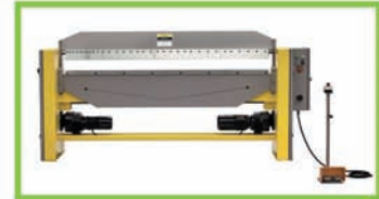
Plieuse motorisée EPPLE AKB2020 - 1,5 ES 2000 x 1,5