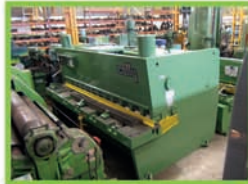
Cisaille COLLY 1632 3000 x 16