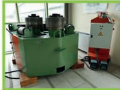
Cintreuse à galets ROUND0 R5