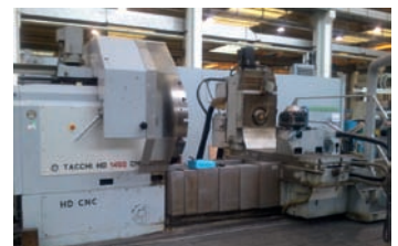
AV Tour TACCHI - Type HD 1450 - CN Num 1060 - ø sur banc : 1300 mm Entrepointe : 4000 mm - Axe C + Axe Y Tél : 05 61 78 85 85