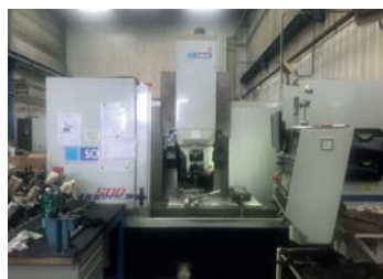
AV Fraiseuse par apprentissage SOMAB Univers 500 - De 2001 - CNC Somap S5 Courses : 1200 x 510 x 500 mm Tél : 03 88 72 02 47